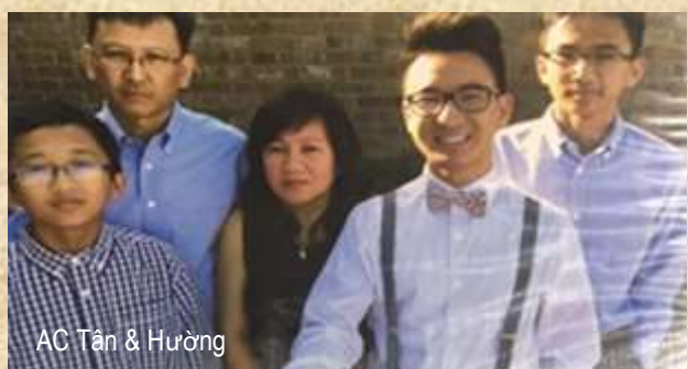
AC Tân & Hường