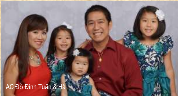
AC Đỗ Đình Tuấn & Hà