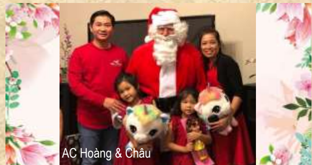
AC Hoàng & Châu