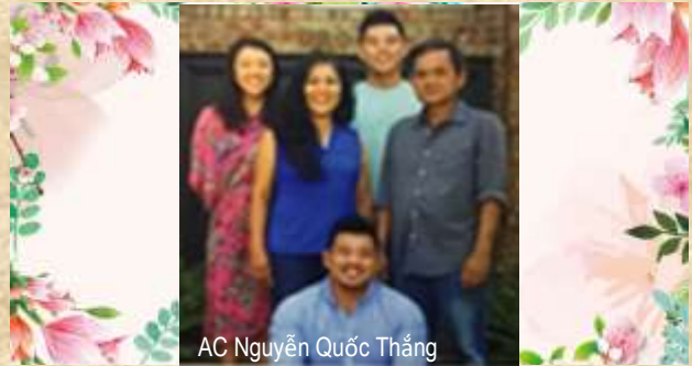
AC Nguyễn Quốc Thắng