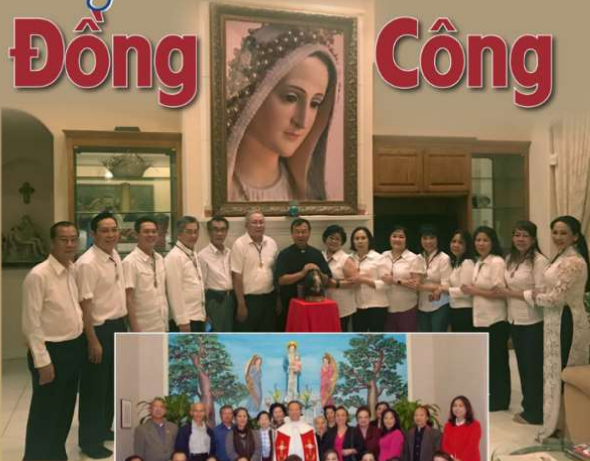
4 Hành hương năm 2011