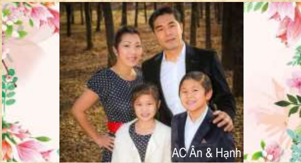
AC Ân & Hạnh