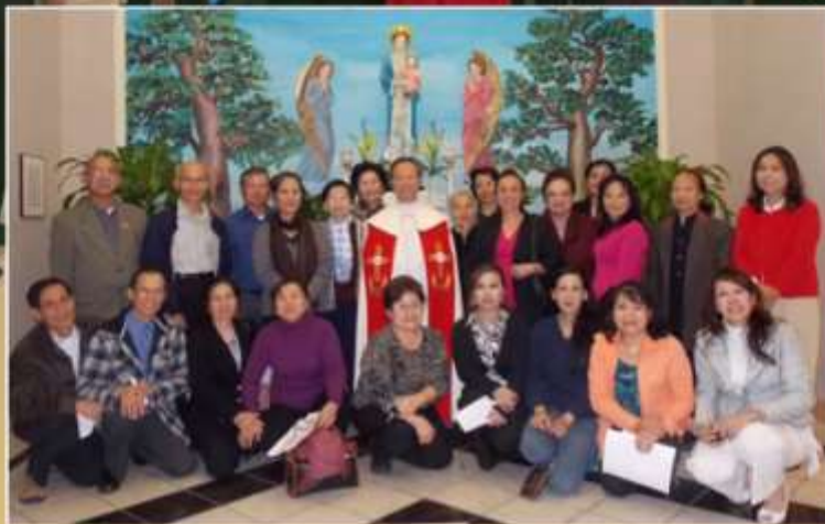
Gia Đình Tân Hiến Đông Công 2011