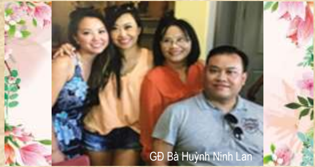
GD Bà Huỳnh Ninh Lan