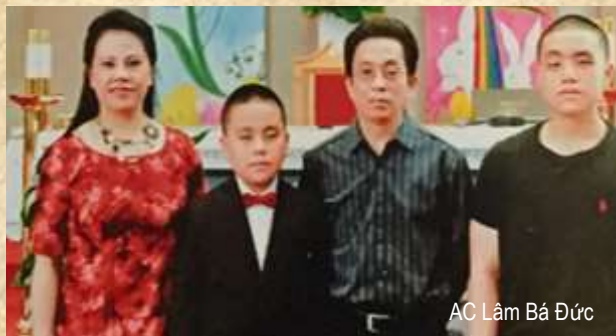
AC Lâm Bá Đức