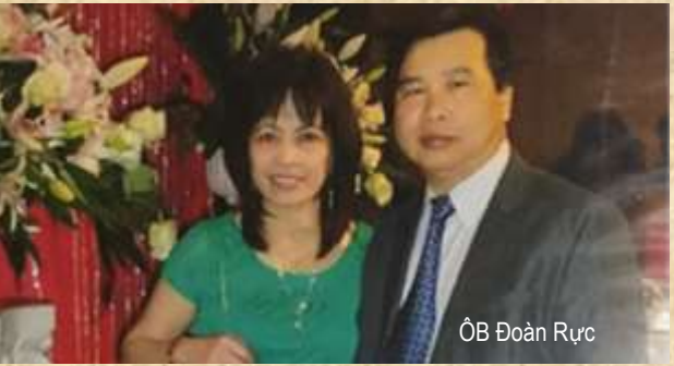
ÔB Đoàn Rực