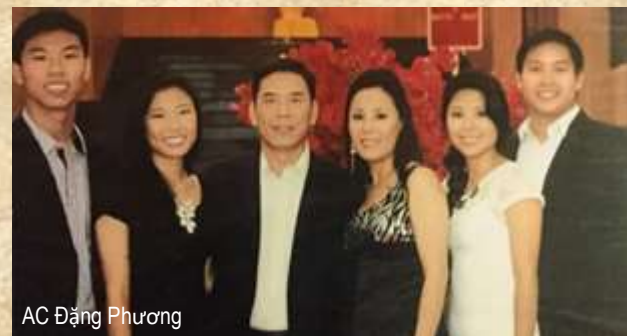
AC Đặng Phương