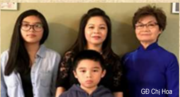
GD Chì Hoa