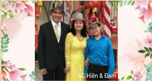
AC Hiền & Đạm