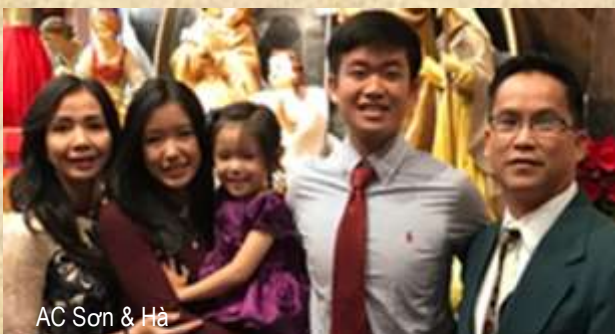
AC Sơn & Hà