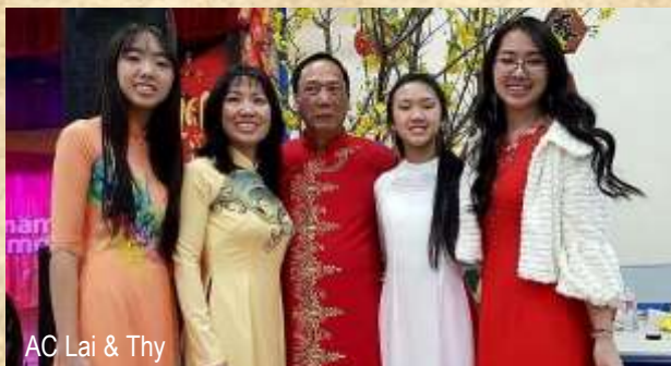
AC Lai & Thy