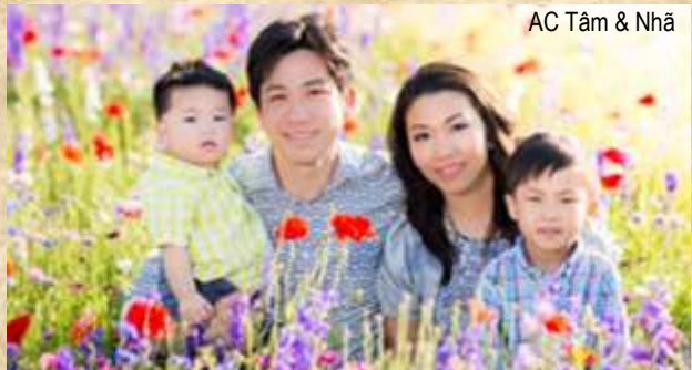
AC Tâm & Nhã