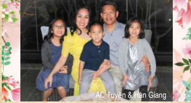
AC Tuyên & Hàn Giang