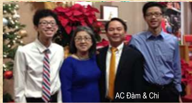
AC Đàm & Chi