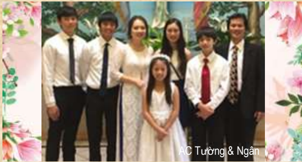
AC Tường & Ngân