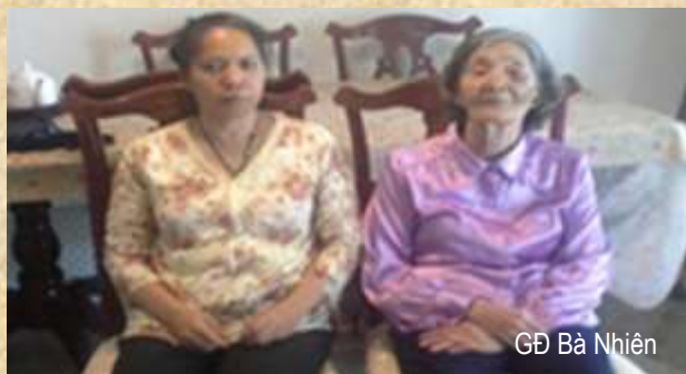
GD Bà Nhiên