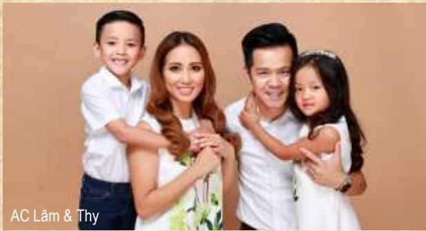
AC Lâm & Thy