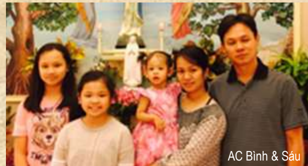
AC Bình & Sáu