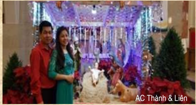
AC Thành & Liên