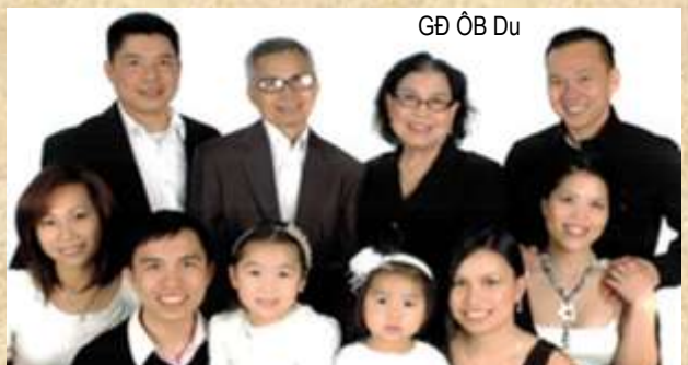
GD ÔB Du