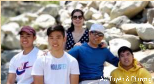
AC Tuyển & Phương