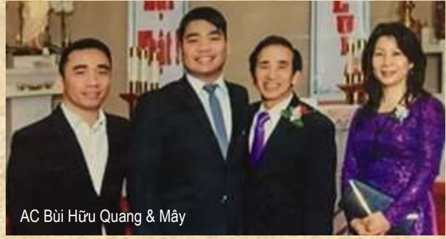
AC Bùi Hữu Quang & Máy